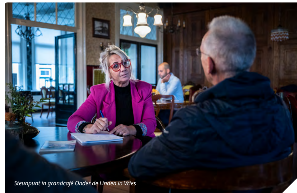
Steunpunt in grandcafé Onder de Linden in Vries

U kunt zonder afspraak bij een steunpunt binnenlopen. Wilt u niet te lang hoeven wachten, kom dan in het laatste uur van de openstelling, de grootste drukte is meestal aan het begin. U vindt de openingstijden per steunpunt op onze website: schadedoormijnbouw.nl/steunpunten .