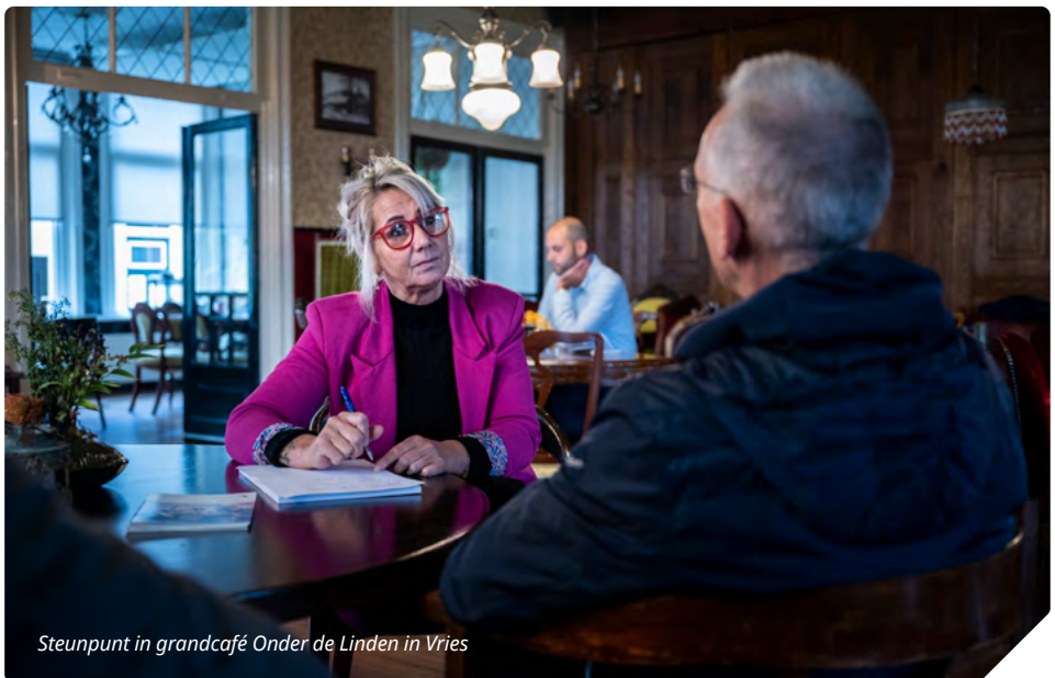
Steunpunt in grandcafé Onder de Linden in Vries

U kunt zonder afspraak bij een steunpunt binnenlopen. Wilt u niet te lang hoeven wachten, kom dan in het laatste uur van de openstelling, de grootste drukte is meestal aan het begin. U vindt de openingstijden per steunpunt op onze website: schadedoormijnbouw.nl/steunpunten .